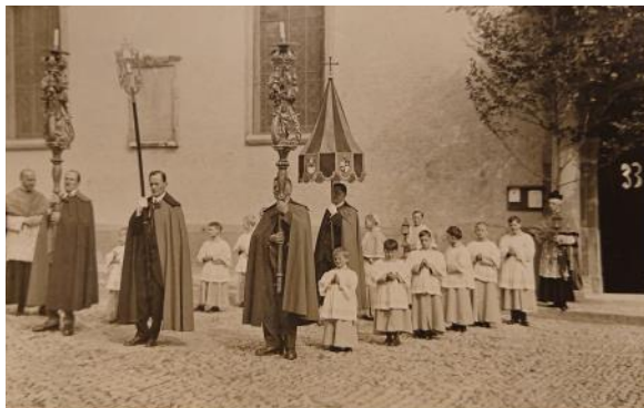
La Basilique à la procession de la Fête-Dieu, vers 1930.

Ce jour-là, pas de messe à la Basilique le matin ; messe solennelle à 18h30 .