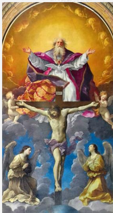
Guido Reni, La Trinité , Rome, église de la Trinité des Pèlerins